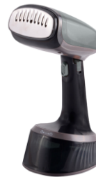
GARMENT STEAMER CR 5033