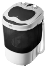
WASHING MACHINE CR 8054