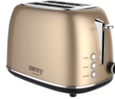
TOASTER 2 SLICES CR 3217