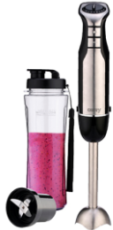
PERSONAL BLENDER CR 4615