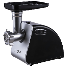
MEAT MINCER CR 4812