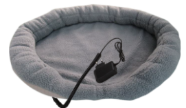
HEATED ANIMAL DEN CR 7431