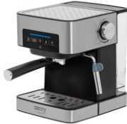
ESPRESSO MACHINE CR 4410