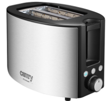
TOASTER 2 SLICES CR 3215