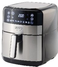
AIR FRYER OVEN CR 6311