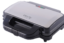
SANDWICH MAKER CR 3054