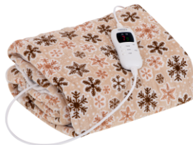
HEATING UNDERBLANKET CR 7430