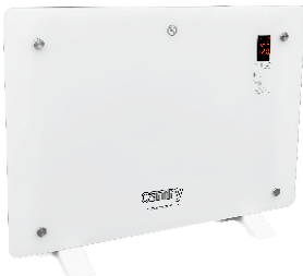
GLASS HEATER CR 7721