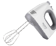
MIXER CR 4220