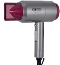
HAIR DRYER CR 2256