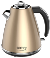
ELECTRIC KETTLE CR 1292