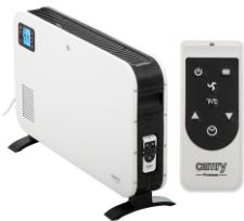
CONVECTION HEATER CR 7724