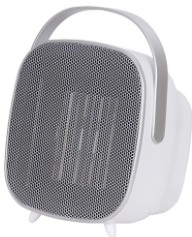
CERAMIC FAN HEATER CR 7732