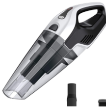
BAGLESS VACUUM CLEANER CR 7046