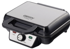
WAFFLE MAKER CR 3046