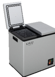
PORTABLE FRIDGE CR 8076