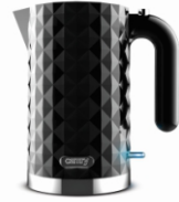
Electric Kettle CR 1169