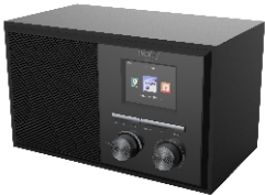
INTERNET RADIO CR 1180