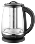
ELECTRIC KETTLE CR 1290