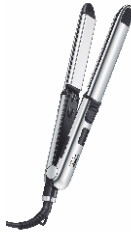
HAIR STRAIGHTENER CR 2320