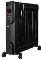
OIL FILLED RADIATOR CR 7814