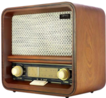
RETRO RADIO CR 1188