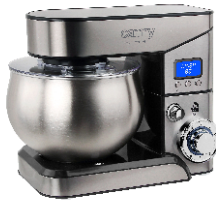
FOOD PROCESSOR CR 4223