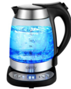
ELECTRIC GRILL CR 3044