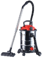
VACUUM CLEANER CR 7045