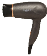
HAIR DRYER CR 2261