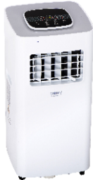
AIR CONDITIONER CR 7926