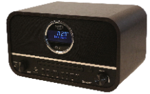
RETRO RADIO CR 1182