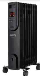
OIL FILLED RADIATOR CR 7812