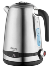
ELECTRIC KETTLE CR 1291