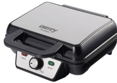
WAFFLE MAKER CR 3046