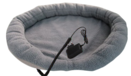
HEATED ANIMAL DEN CR 7431