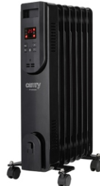
OIL FILLED RADIATOR CR 7812