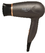
HAIR DRYER CR 2261