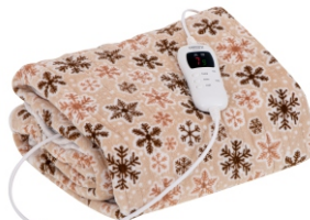
HEATING UNDERBLANKET CR 7430