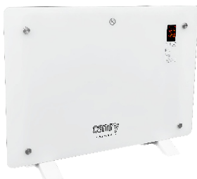
GLASS HEATER CR 7721