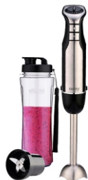
PERSONAL BLENDER CR 4615