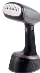
GARMENT STEAMER CR 5033