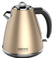
ELECTRIC KETTLE CR 1292