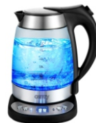
ELECTRIC GRILL CR 3044