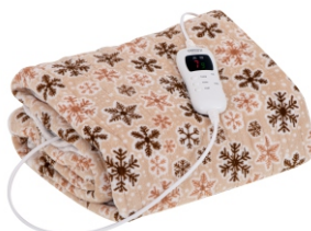
HEATING UNDERBLANKET CR 7430