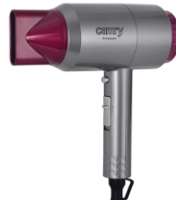
HAIR DRYER CR 2256