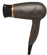
HAIR DRYER CR 2261