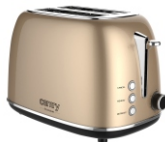
TOASTER 2 SLICES CR 3217