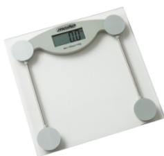
Bathroom Scale MS 8137