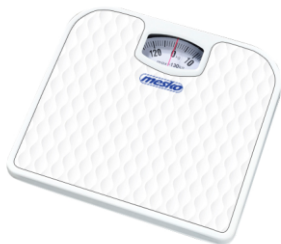
Bathroom scale MS 8160