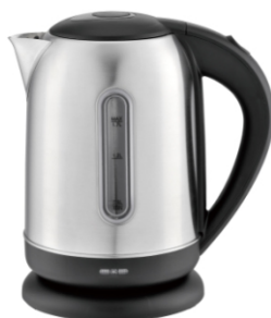
Electric Kettle MS 1288