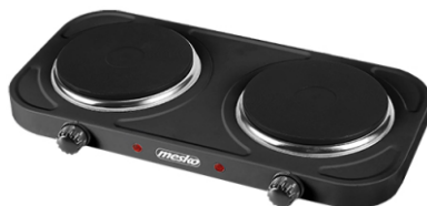
Double hot plate MS 6509