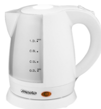
Electric Kettle MS 1276