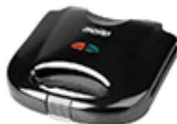
Sandwich Maker MS 3032