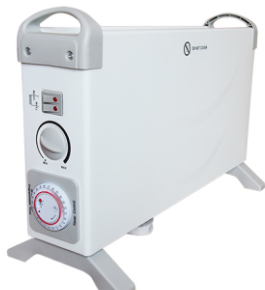
Convecter heater MS 7713