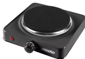
Hot Plate MS 6508