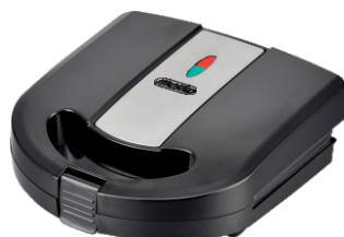
Sandwich Maker MS 3045