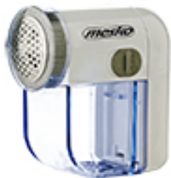
Lint remover MS 9610