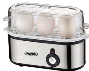
Egg Boiler MS 4485