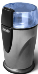
Coffee Grinder MS 4465