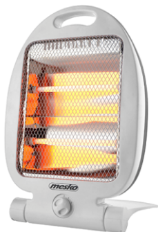
Quartz Heater MS 7710