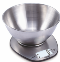
Kitchen Scale MS 3152