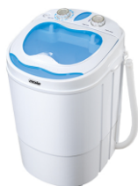
Washing machine MS 8053