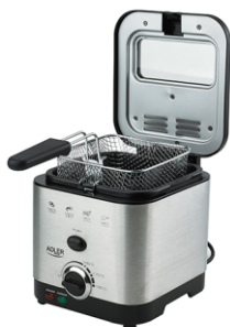
Deep Fryer 1,5L MS 4911