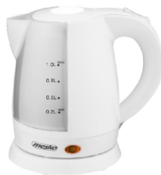
electric kettle MS 1276