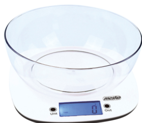
Kitchen scale with bowl MS 3165