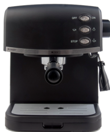
Espresso Maker MS 4409