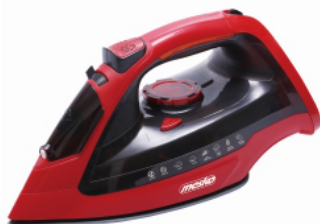
Steam Iron MS 5031