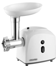
meat grinder MS 4805